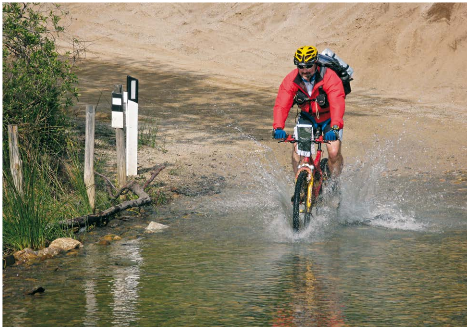
An der Furt beim Rückweg nach Piscinas. Bald ist das Ziel erreicht und der Strand lädt zum Badespaß.

Eine einfache, mittellange und sehr schöne Tour für jedermann. Auf kaum befahrener kleiner Straße, entlang der Küste und auf guter Piste durch ein al- tes Bergbaugbiet trifft man zum Ab-